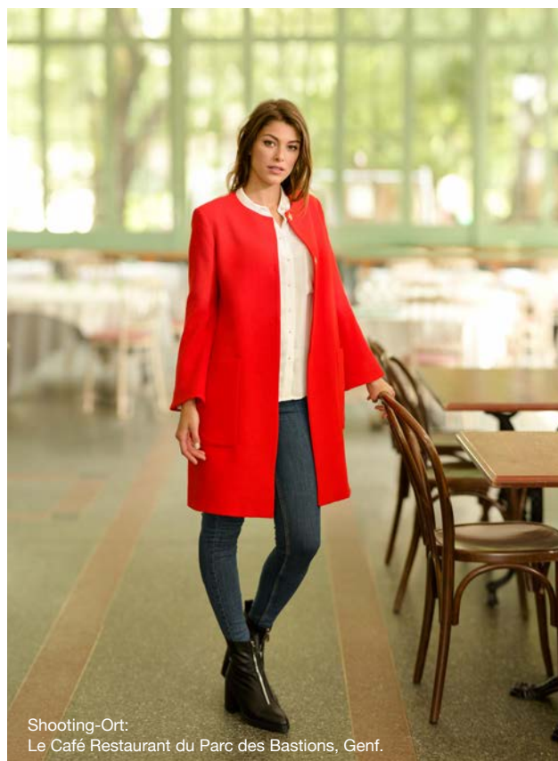
Shooting-Ort: Le Café Restaurant du Parc des Bastions, Genf.

Ob dekorativer Zierstich oder praktischer Nutstich, Sie werden von der Präzision und Gleichmäßigkeit des Stichbildes begeistert sein. Bei Modell 570 können Sie Ihre individuellen, einzigartigen Stichfolgen speichern.