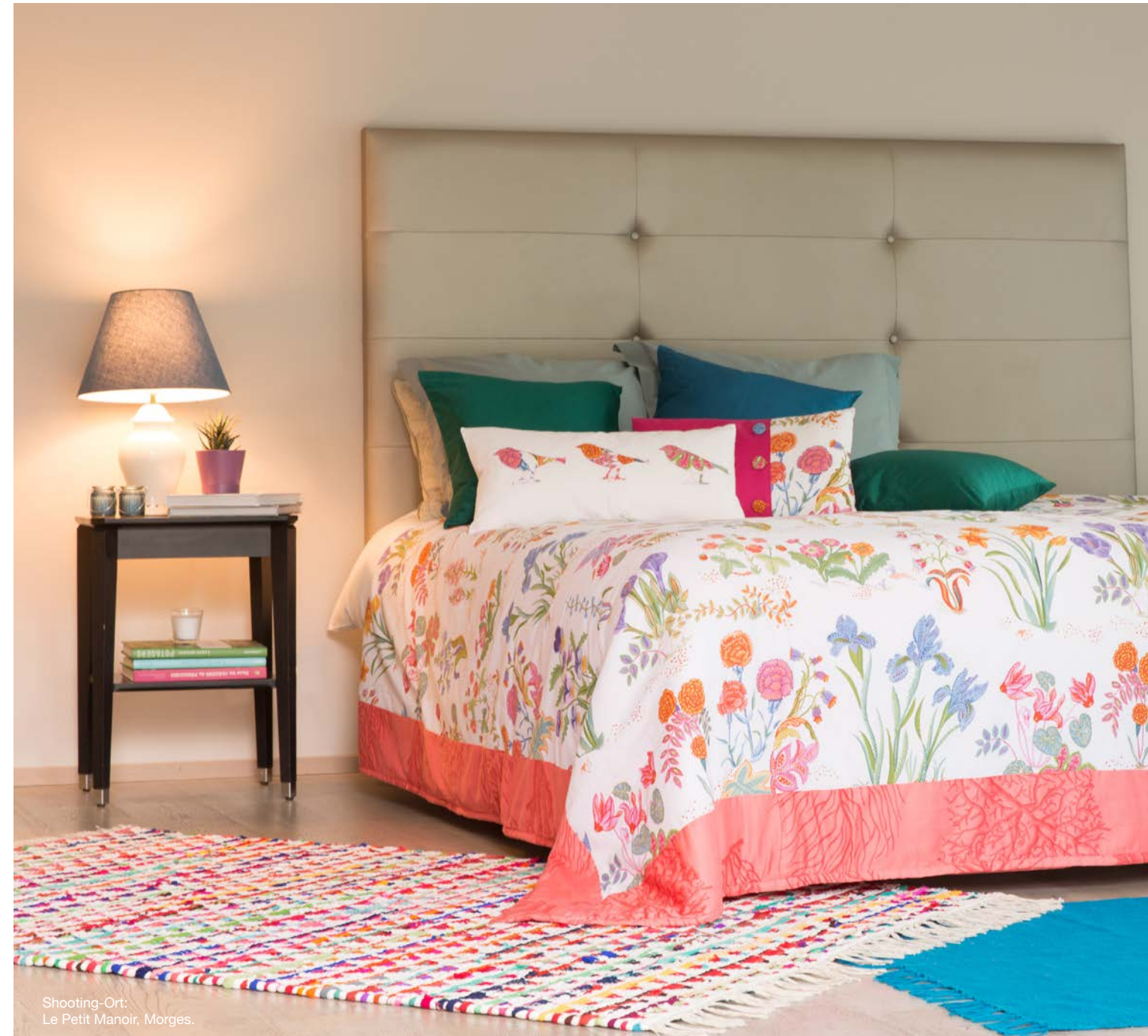
Shooting-Ort: Le Petit Manoir, Morges.

Viele praktische Funktionen machen Ihre Nähaufgaben leichter, schneller, angenehmer.